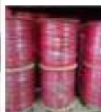
Cables para Incendios

Desde el 2000 fabricamos cables de máxima calidad